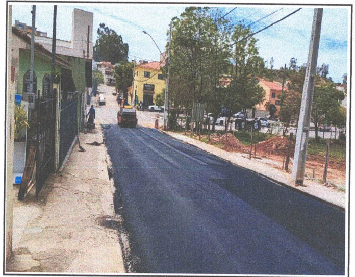
PAVIMENTAÇÃO - RUA PADRE JOSÉ ORIOLO