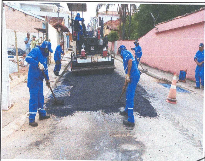
PAVIMENTAÇÃO - RUA CÂNDIDO LAMY