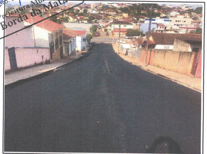
PAVIMENTAÇÃO - RUA PROF. AFONSO A. FLORENCIANO