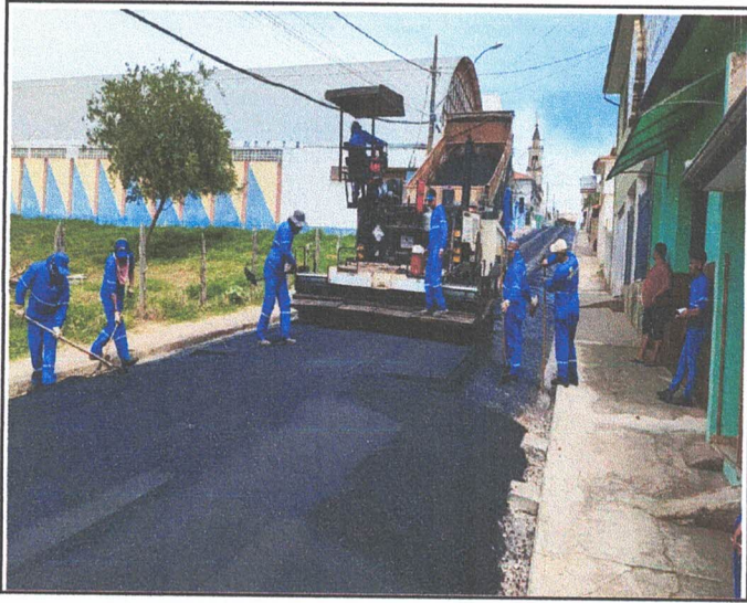
PAVIMENTAÇÃO - RUA PADRE JOSÉ ORIOLO