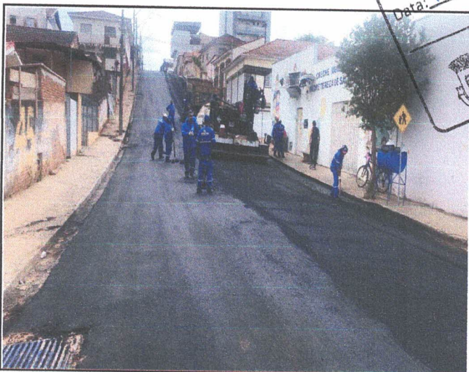
PAVIMENTAÇÃO - RUA PROF. AFONSO A. FLORENCIANO

APROVADO Data: 18/10/22 Depto. Engenharia Prefeitura Municipal Borda da Mata